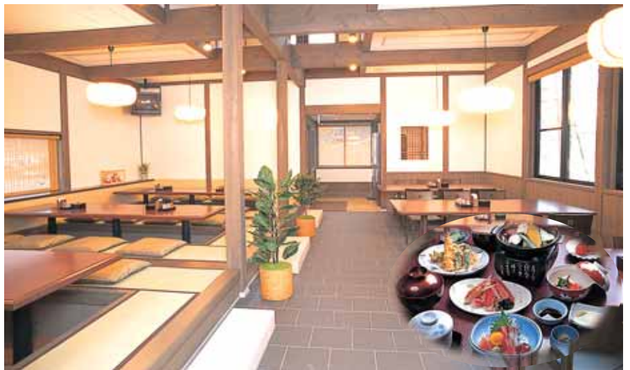
お食事処「源平茶屋」

絵手紙、陶芸等が楽しく学べる講座を開催しています。どなたでも自由に楽しくチャレンジ。