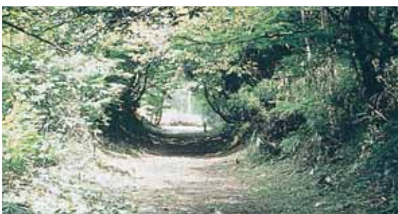
うっそうとした緑に包まれる現在の北陸道