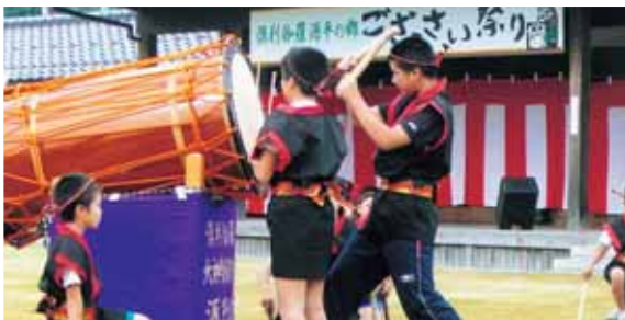
倶利伽羅源平の郷「ござっさい祭」