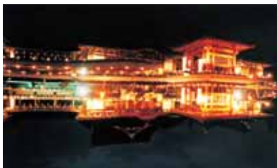
倶利伽羅不動尊 西の坊鳳凰殿